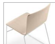
Monocasco de madera