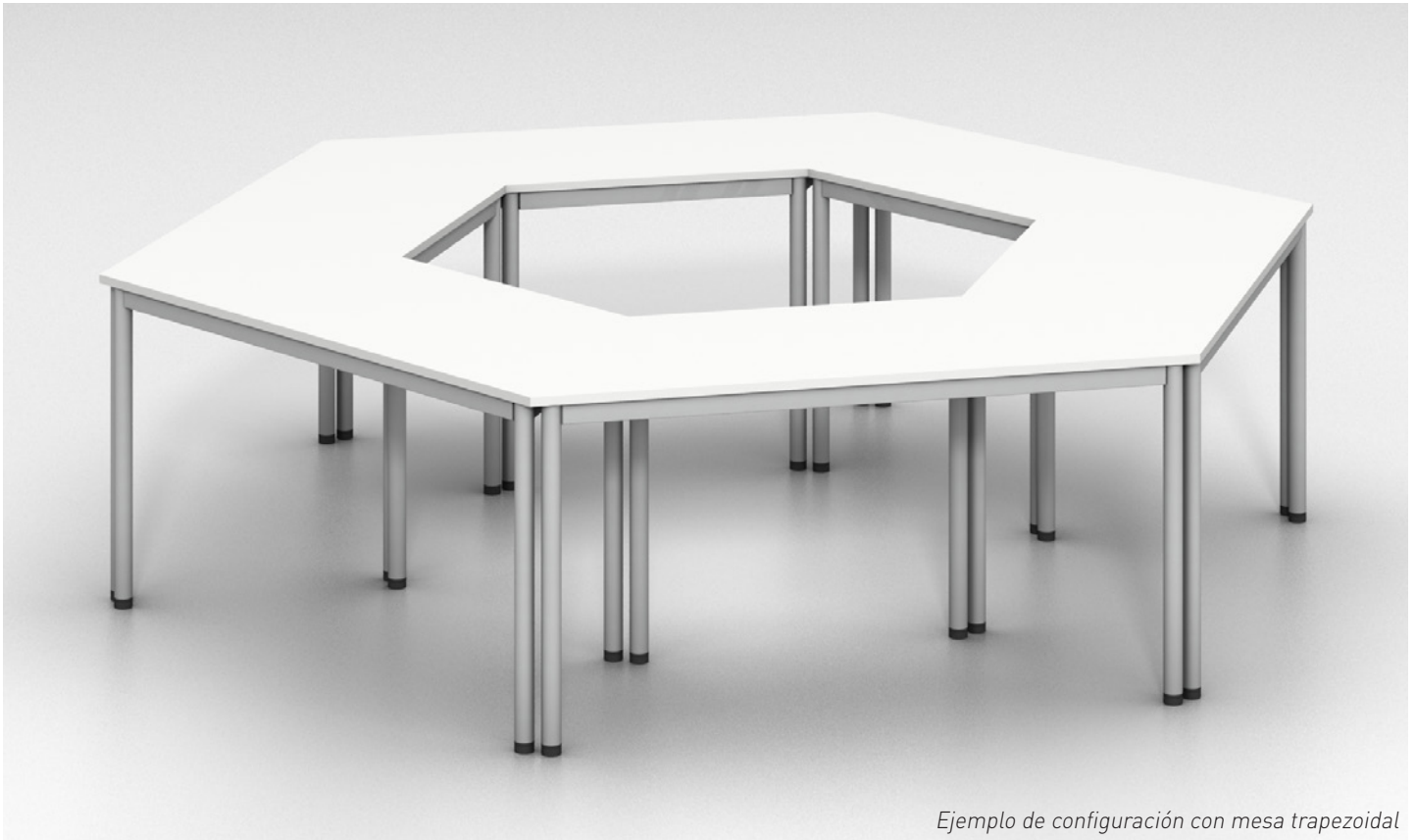
Ejemplo de configuración con mesa trapezoidal