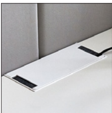
Salida "T". Push Latch