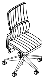
Silla de trabajo con detalles de costura