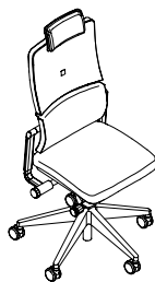
Silla de trabajo con reposa cabeza