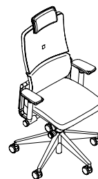
Versión Executive con cuero y aluminio pulido