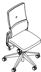
Silla de trabajo