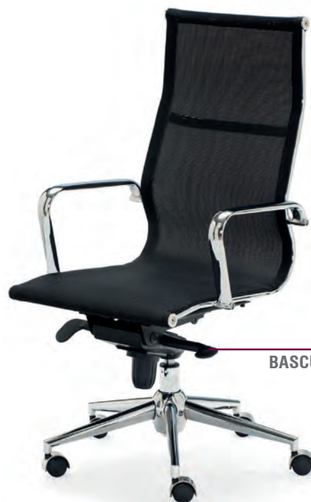
BASCULANTE LUX 4 pos.

BERLÍN tiene un mecanismo basculante de inclinación Lux, lo cual se traduce en mayor confort y libertad de movimientos. A diferencia de otros sistemas, es posible fijar la inclinación en 4 posiciones diferentes, así como la dureza o tensión con la que actúa.