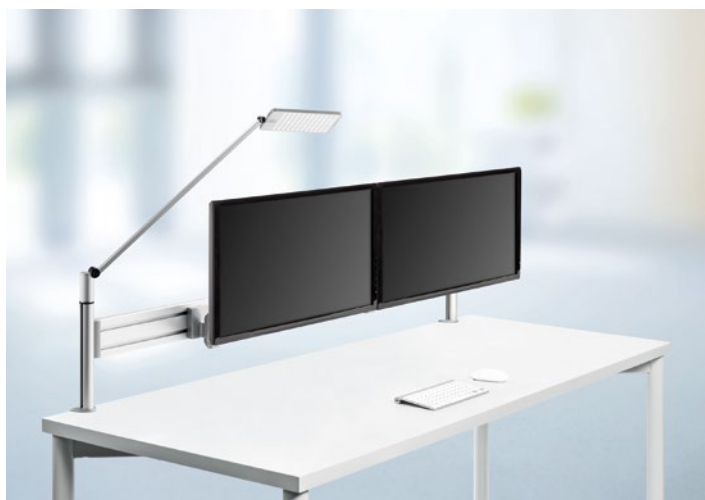
Office Toolbar Duo, plata