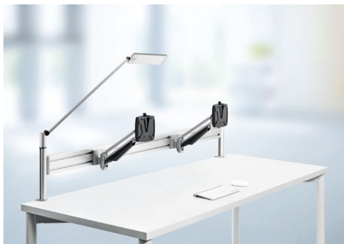
Office Toolbar Duo, plata