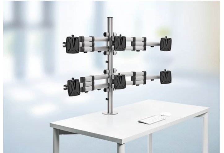
Soporte para NOVUS TSS Sextett Teleskop