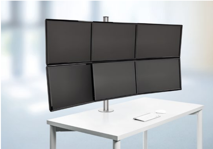
Soporte para NOVUS TSS Sextett Teleskop